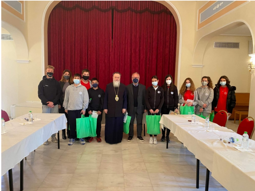
Μητροπολίτης Κορίνθου: Πνευματικός ταγός και εκκλησιαστικός ηγέτης