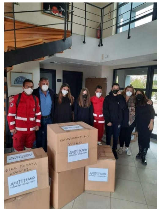
Τι συμβαίνει μετά από μία πυρκαγιά